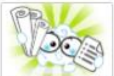
教學視學單 適用年級：6年級 20A