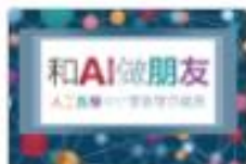
和AI做朋友 人工智慧與AI+學習的應用 12 有AI做朋友-人工智慧中小學教學案例 適用年級：5年級-12年級