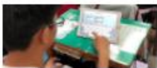
nearpod 新北市民立高第4年級國語 國家自然科