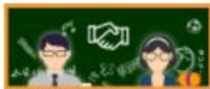
教育大市集夥伴對話教案