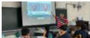
kubook 新北市民立雙溪國中 國語國文科