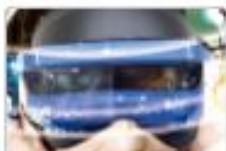
VR/AR教學應用教材 適用年級：3年級-12年級 27