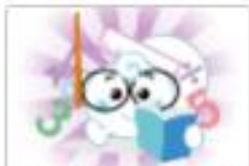
創新教學設計 適用年級：6年級 20A