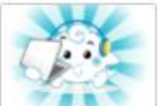
創客與自造者資源 適用年級：6年級 20A