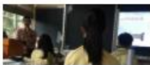
海洋生物多樣性障礙 單元學習單 新北市民立高第4年級國語 國家自然科