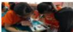
世界歐英英語單字與會詞對照 臺南市立雙溪國中 國語國文科